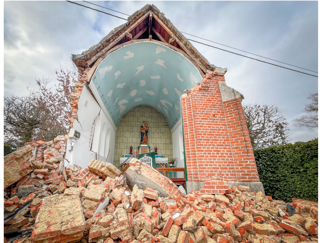
Kapel Hoop der Hopelozen, Gemeente Sint-Katelijne-Waver.